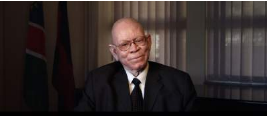
Zephania Kameeta, Minister für Armutsbekämpfung und soziale Wohlfahrt

2006 gründete der Schweizer Unternehmer Daniel Häni die Initiative Grundeinkommen, eine politische Bewegung zur Durchsetzung des Grundeinkommens in Deutschland und der Schweiz: „Das Geld ist schon da und jeder hat schon heute ein Grundeinkommen, nur eben kein bedingungsloses. Und wenn jemand sagt, es sei eine gute Idee, aber leider kann man es nicht finanzieren, der sollte besser sagen: „Ich will doch nicht, dass die Leute selber bestimmen können.“