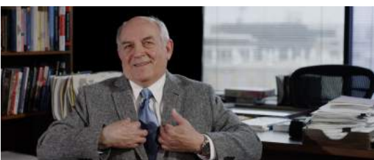
Charles Murray, Libertärer Politikwissenschaftler