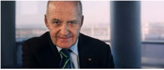
Götz Werner, Unternehmer

Einer, der zu Beginn des 21. Jahrhunderts darüber nachdachte, wie man Arbeit und Einkommen entkoppeln kann, war Götz Werner, Gründer der größten europäischen Drogeriemarktkette: „Wenn das Grundeinkommen eingeführt werden würde, weil’s die Gesellschaft denken kann, dann verändert sich die ganze Welt. Dann ist nichts mehr so, wie es vorher war.“